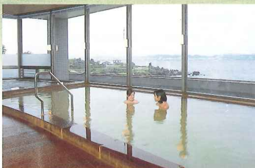
マグマ温泉 HOT SPRING

穏やかな錦江湾(鹿児島湾)と、歴史と文化溢れる鹿児島市内が望めるゆったりとした空間です。